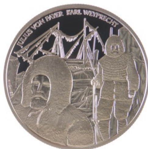
Pamětní mince vydaná roku 2005 na počest polární expedice na lodi Admirál Tegetthoff